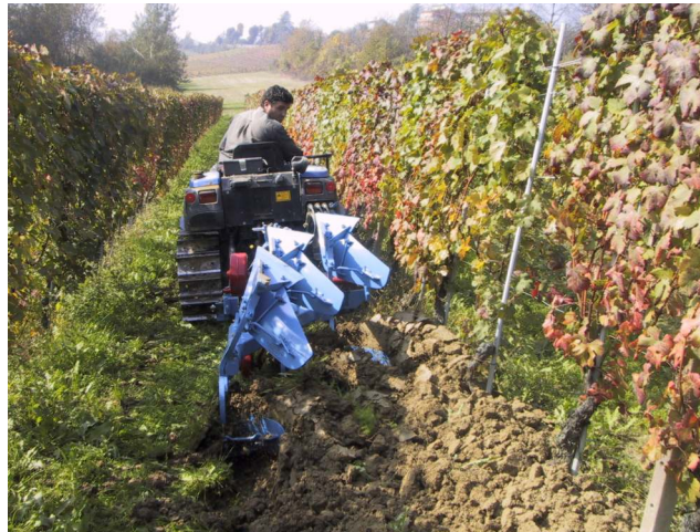
Aratro Bivomere Tipo VO-T3

Aratro trivomere reversibile per vigneti a giropoggio, particolarmente adatto al lavoro di riporto a monte del terreno. La sua particolare caratteristica, oltre ad essere compatto e maneggevole, è il terzo vomere inclinabile internamente. Quando si effettua l'aratura dalla parte superiore del filare per riportare a monte il terreno, questa particolarità consente di avvicinarsi il più possibile alle spalle dei filari. L'inclinazione del terzo vomere avviene contemporaneamente con il capovolgimento dell'aratro, riportando il corpo superiore in posizione normale di aratura