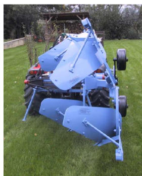
Aratro Bivomere Tipo VO-T7-FS