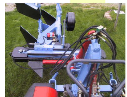
Spostamento di fuori e fine solco Bivomere Tipo VO-T7-FS

Pesi e misure non sono impegnativi la ditta costruttrice si riserva di apportare modifiche senza preavviso