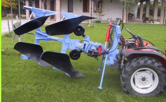
Aratro Bivomere Tipo VO-T7-FS

Questi aratri sono particolarmente indicati per trattori cingolate o per specifiche arature fuori solco con trattori gommatidi tipo frutteto.