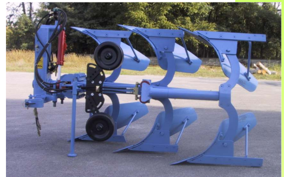
Trivomere Tipo VO-T4 fine solco