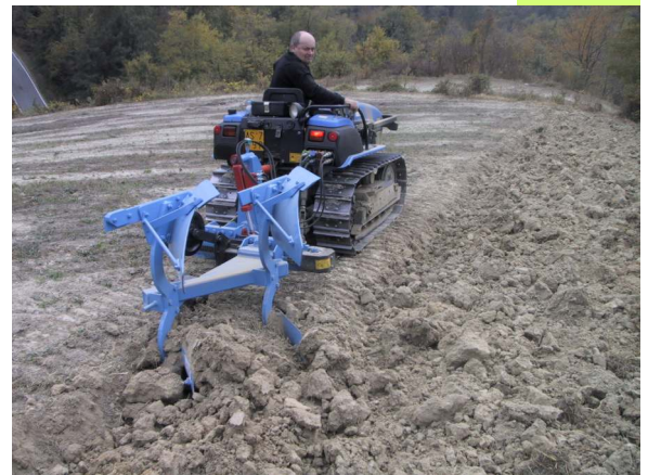
Aratro Bivomere Tipo VO-T7 in campo aperto